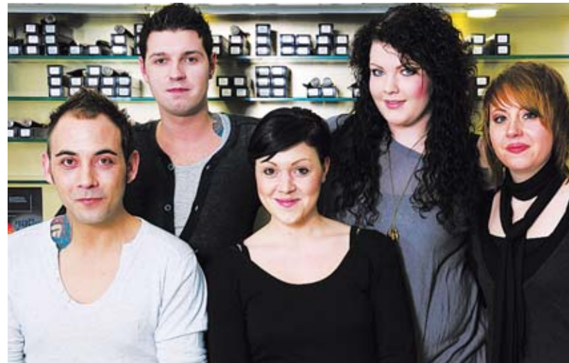
Das Team von der Haarbar xpress freut sich auf Ihren Besuch!

Regelmäßige Schulungen garantieren, dass die Teammitglieder des Sa-