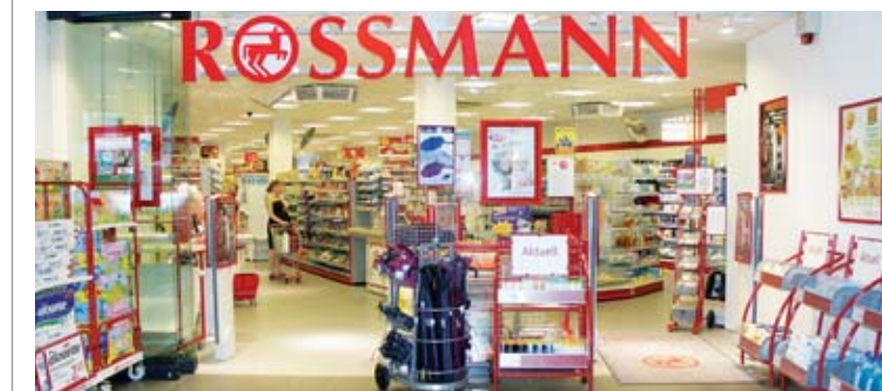
Rossmann bietet auch eine riesige Auswahl an Pflege- und Wellness-Produkten für Sie und Ihn.

soire zum Schutz der Augen. So bietet „Kiek Mal!“ zum Beispiel auch Modelle wie die von Maui Jim. „Diese Sonnenbrille gilt als die Weltbeste, denn sie bietet klarsten, kontrastreichsten und angenehmsten Sehkomfort“, sagt der Optikermeister. Für Brillenmuffel hat der Optiker auch Kontaktlinsen in seinem Sortiment. Geöffnet hat „Kiek Mal!“ Mo-Fr 10-19 Uhr und Sa 10-16 Uhr.