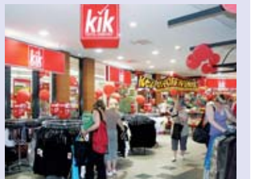
KiK eröffnete Anfang Juni im Untergeschoss.

Die KiK-Neueröffnung im Basement des Neumann Forums am 7. Juni hat viele Neugierige angezogen. Durch seine größere Fläche konnte KiK sein Angebot nun erweitern und sein Warenangebot noch übersichtlicher präsentieren.